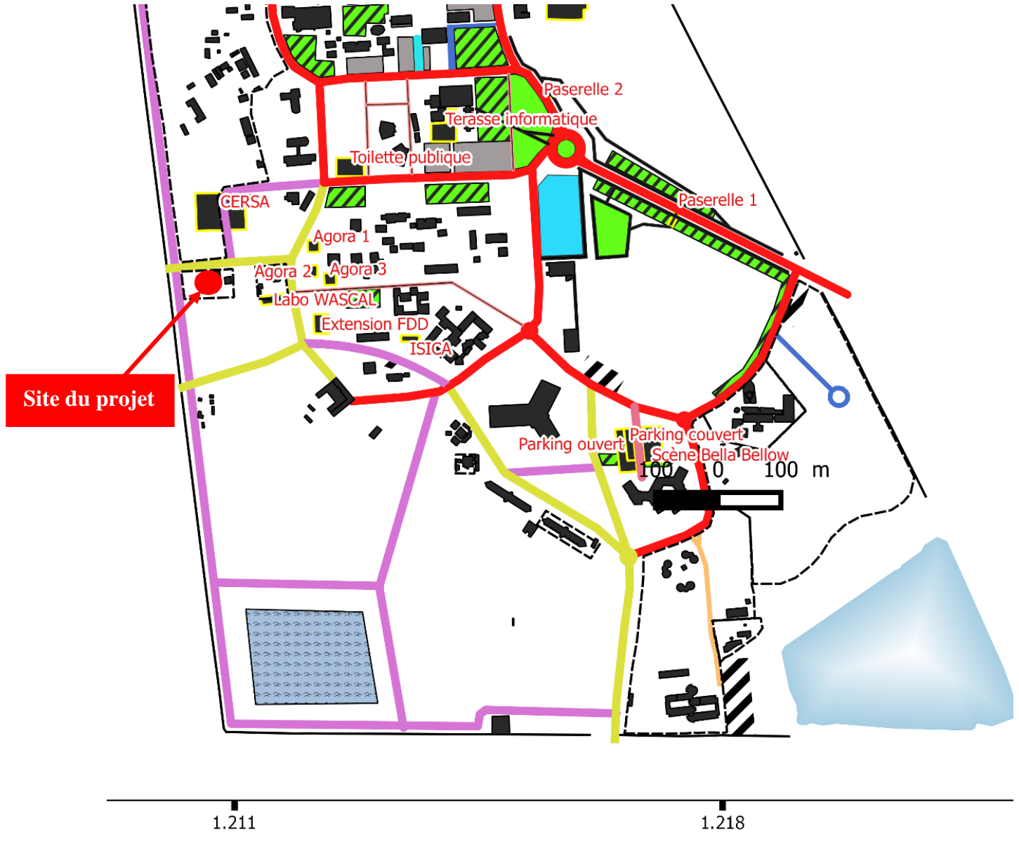
Figure 4.1 : Zone de projet

Le site du projet est situé au campus Sud de l'Université de Lomé dans l'enceinte de l'Université de Lomé représenté sur la figure 4.1