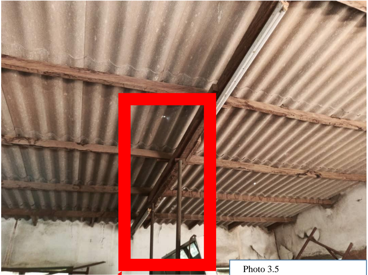
Thés métallique supportant la charpente.