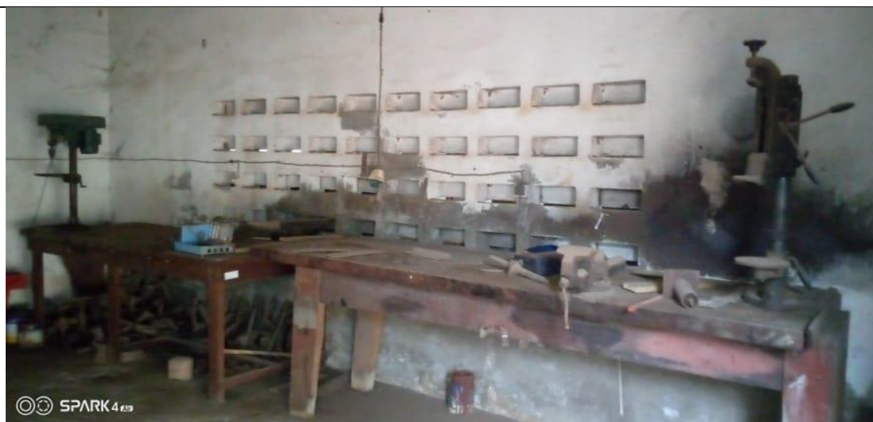
Laboratoire de l'ENSI à rénover

Le site qui servira à la rénovation des salles de classe et des laboratoires didactiques du département de Génie Électrique de l'École Nationale Supérieure d'Ingénieurs (ENSI) est situé dans l'enceinte de l'UL, dans la Commune du Golfe 3.